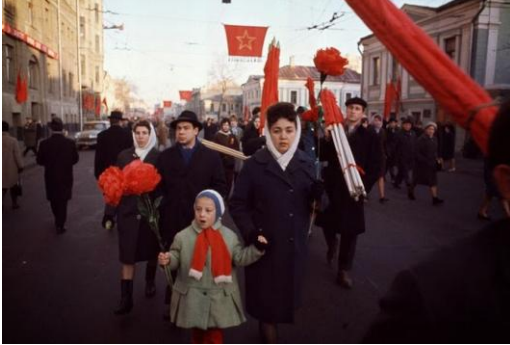
Sovyetlerde Ekim Devrimi kutlamaları