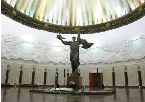
Büyük Yurtseverlik Savaşı Müzesi