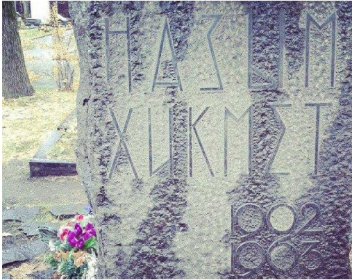
Büyük şair Nazım Hikmet'in mezarı