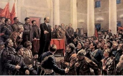
Lenin Smolni'de işçi, köylü, asker Sovyetleri Tüm Rusya II. Kongresi'nde Sosyalist Devrim'in zaferini ilan ediyor "Kışlık Saray'da Kerenski. Smolni'de Sovyetler ve Lenin, sokakta onlar." – Nazım Hikmet