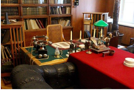
Lenin'in çalışma odası, Gorki Leninskiye