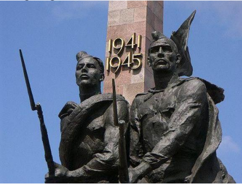
Leningrad'ın Kahraman Savunucuları Anıtı