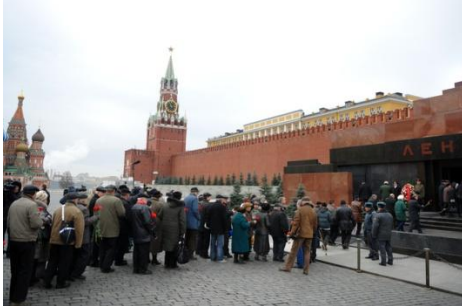
Kızıl Meydan'da Lenin Mozolesi'ne karanfiller bırakılıyor